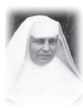
คุณแม่ราฟาแอล วูร์นิก