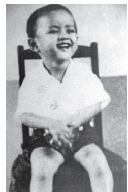
พระเจ้าวรวงศ์เธอพระองค์เจ้าอานันทมหิดลและพระเจ้าวรวงศ์เธอพระองค์เจ้าภูมิพลอดุลยเดช (พระยศในขณะนั้น) ทรงเข้าศึกษาในชั้นคินเดอการ์เตน