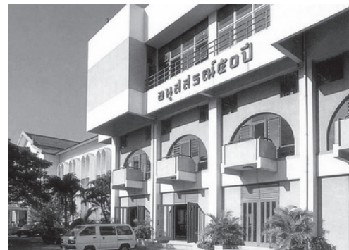
อาคารอนุสรณ์ 50 ปี

พ.ศ. 2538 อาคารเรียนอนุบาลและมัธยมศึกษา ก่อสร้างเสร็จและเริ่มต้นใช้ในการเรียนการสอน ปัจจัยการก่อสร้างมาจากความช่วยเหลือจากนักเรียนเก่าและผู้ปกครองนักเรียนอีกเช่นกัน