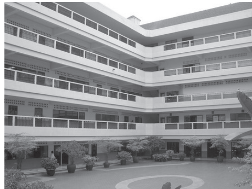
อาคารเฉลิมพระเกียรติ เป็นอาคารเรียนของอนุบาลและมัธยมศึกษา