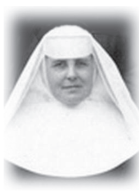
คุณแม่มารีแบร์นาร์ดี มังแซล