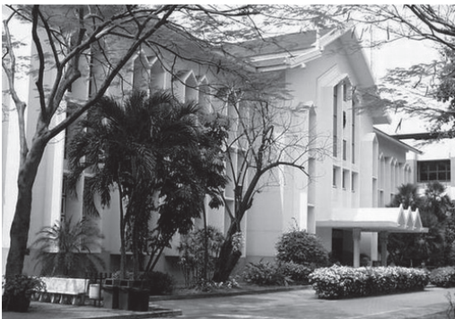
อาคารหอประชุม

พ.ศ. 2521 สมาคมนักเรียนเก่ามาแตร์เดอี ในพระบรมราชูปถัมภ์ และสมาคมผู้ปกครองและครูร่วมกัน หาทุนสร้างตึกพลานามัย ซึ่งตั้งชื่อว่า “อนุสรณ์ 50 ปี” พระเจ้าวรวงศ์เธอ พระองค์เจ้าโสมสวลี พระวรราชาทินัดดามาตุ เสด็จเปิดอาคารเมื่อวันที่ 4 กันยายน พ.ศ. 2525