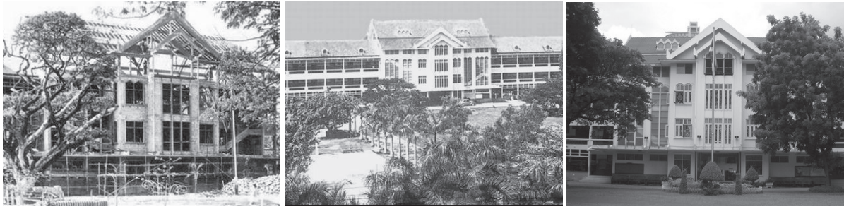
อาคารเรียนใหม่สร้างแล้วเสร็จในปี 2506 ปัจจุบันใช้เป็นอาคารเรียนประถมศึกษา

เมื่อวันที่ 22 มีนาคม พ.ศ. 2509 หม่อมเจ้าวงศานุวัตร เทวกุล ราชเลขาธิการได้มีหนังสือที่ รล 0002/983 แจ้งแก่นายกสมาคมนักเรียนเก่ามาแตร์เดอี ว่า พระบาทสมเด็จพระเจ้าอยู่หัวทรงรับสมาคมนักเรียนเก่ามาแตร์เดอี ไว้ในพระบรมราชูปถัมภ์